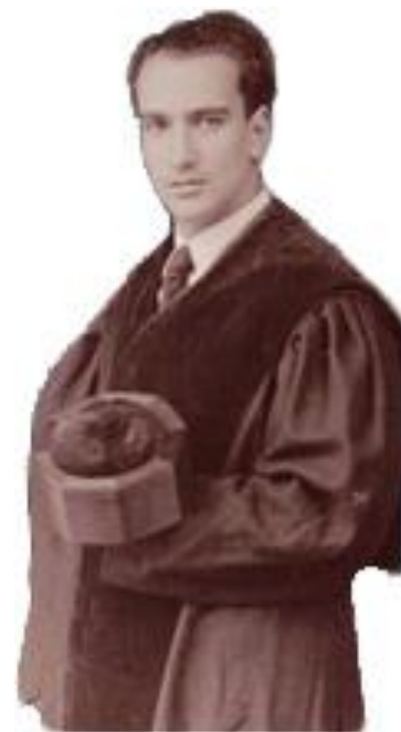
Abuelo del Entrevistado. Aparece en la portada de su primer libro.

¿Que tipo de lectura o música te gusta? Suelo leer ensayos y poesía y de música sigo con mis vinilos, algunos casi incunables, de los años ochenta –música española- y la música inglesa de los sesenta y setenta. Estuve un año durante los fines de semana poniendo música en un bar de copas en el año 90. Tengo en casa muchísimos discos que sigo escuchando en el tocadiscos. Me gusta mucho Silvio Rodríguez, Roy Orbison, The Cure, Antonio Vega, Los Sabanderos y el gregoriano –mucho y diferente, como verás-.